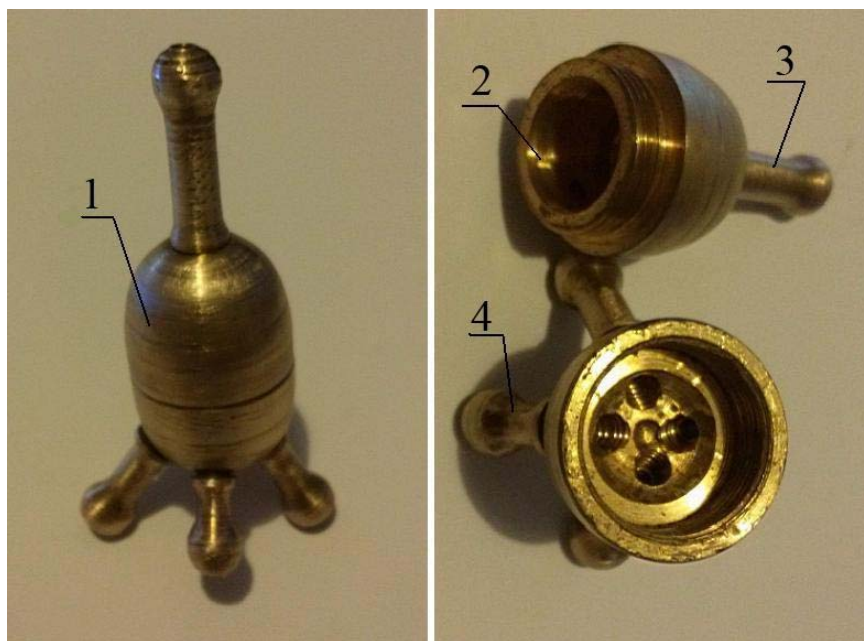
Рис. Б. Звукорозподільний пристрій

Велика площа голівок стетофонендоскопа сприяє достатній глибині прослуховування внутрішніх органів великих тварин і їх легко підсовувати під лопатку, плече та інші ділянки тіла, особливо, за вимушеного лежачого положення тіла.