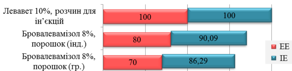
Рис. 2. Терапевтична ефективність антигельмінтних засобів групи імідотіазолу за трихурузу овець

Серед препаратів хімічної групи імідотіазолу найдієвішим (ЕЕ, ІЕ – 100 %) виявився Левавет 10 % (рис. 2).