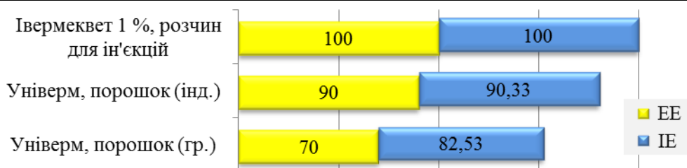
Рис. 3. Терапевтична ефективність антигельмінтних засобів групи макролідів за трихуризу овець

А використання порошку Універму груповим способом та індивідуально знижувало показники його терапевтичної ефективності. EE препаратів за різних способів застосування становила 70 та 90 % за IE – 82,53 та 90,33 % відповідно.