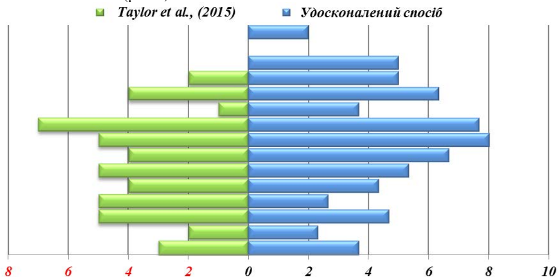
Рис. 1. Порівняння удосконаленого способу копроовоскопічної діагностики з прототипом за якісними та кількісними показниками, n=15

За результатами дослідів із визначення діагностичної ефективності удосконаленого способу та прототипу зареєстровано високу діагностичну ефективність пропонованого нами способу за якісними та кількісними показниками (рис. 1).